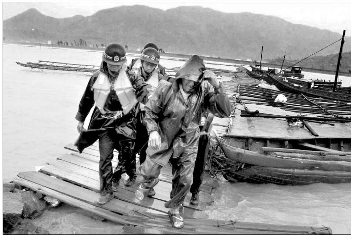
15. taifuuni tänä vuonna. Kiinalaiset sotilaat vievät turvaan kalastajan (edessä) Leqingin kaupungissa itäisen Kiinan rannikolla Zhejiangin maakunnassa sunnuntaina. Itä-Kiinassa on evakuoitu miljoonia ihmistä hirmumyrsky Khanun tieltä.